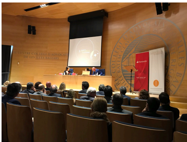
iMeeting – Col·legi d'avocats de les Illes Balears