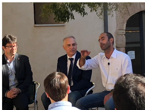
Jornada Empren-Chem IB Talks