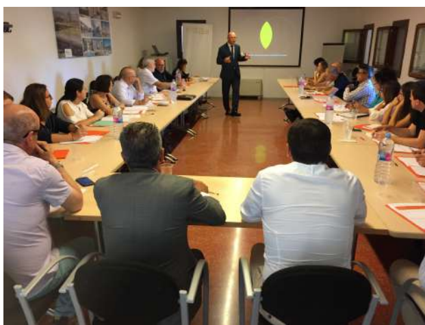
Ágora Impulsa – Parc Bit