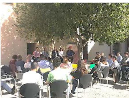
Jornada Empren-Chem IB Talks